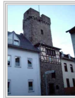
3. Kleiner Wehrturm Hintermauergasse