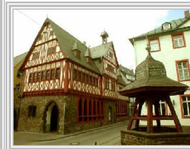
Altes Rathaus und Marktbrunnen