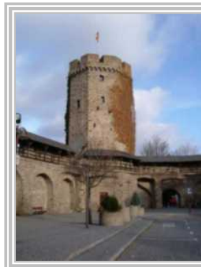
1. Hexenturm Salhofplatz