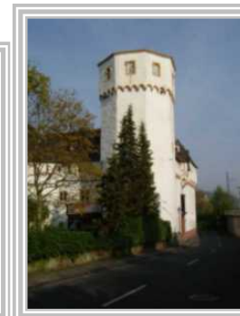
5. Weinsberger Turn Martinsschloss