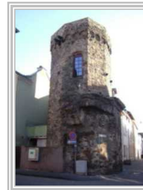
2. Bürgerturm Hintermauergasse 1