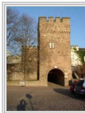
6. Kihrstor Am Rheinufer