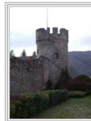
7. Salturm Pfarrgasse 6