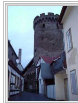
4. Pulverturm Hintermauergasse